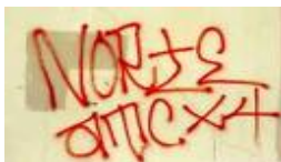
Pintada norteña en pintura roja con X4 (14).

Insane Clown Posse/Juggalos, Tagger crews, Straight Edge