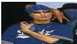
Uso de la playera azul de los Dodgers y bandana para representar a los "Crips".