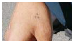
3 puntos, muchas veces con un punto en la otra mano, para simbolizar el "13".