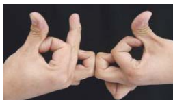
Signo de mano que indica la palabra "blood".